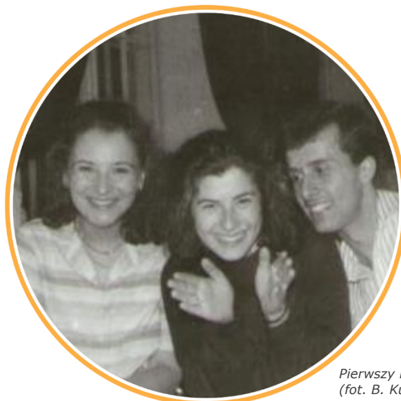
Pierwszy kongres EGEA w Zaborowie, 1989 r.