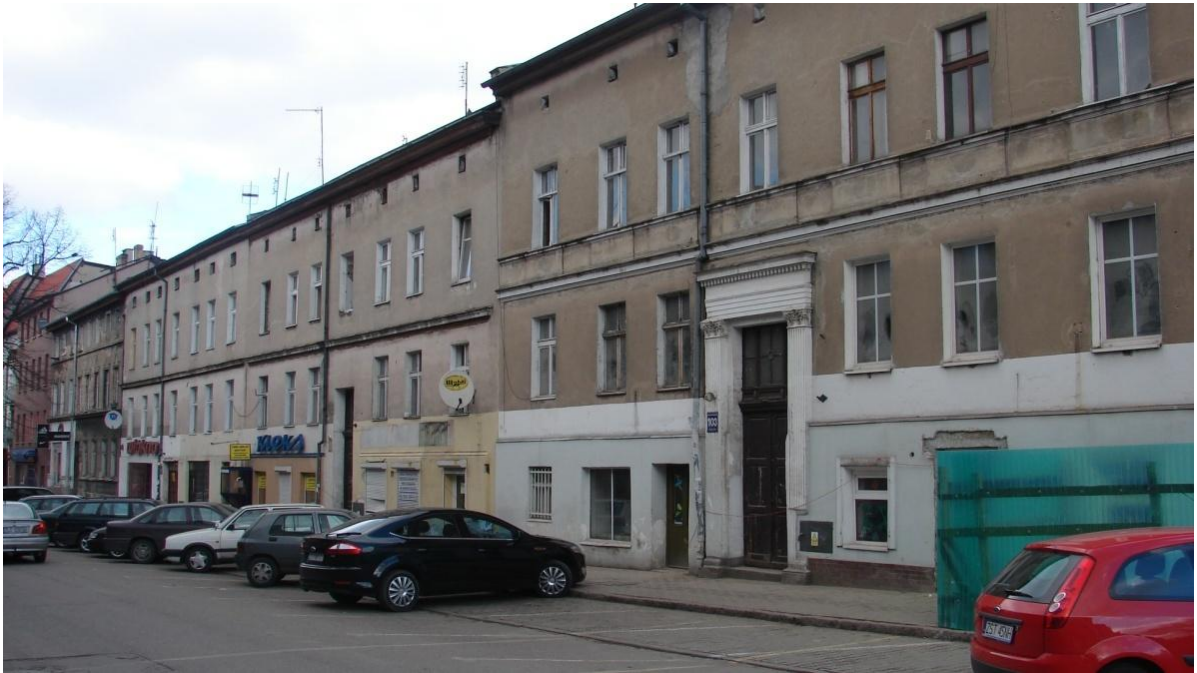
Budynki przy ul. M.J. Piłsudskiego przed rewitalizacją.