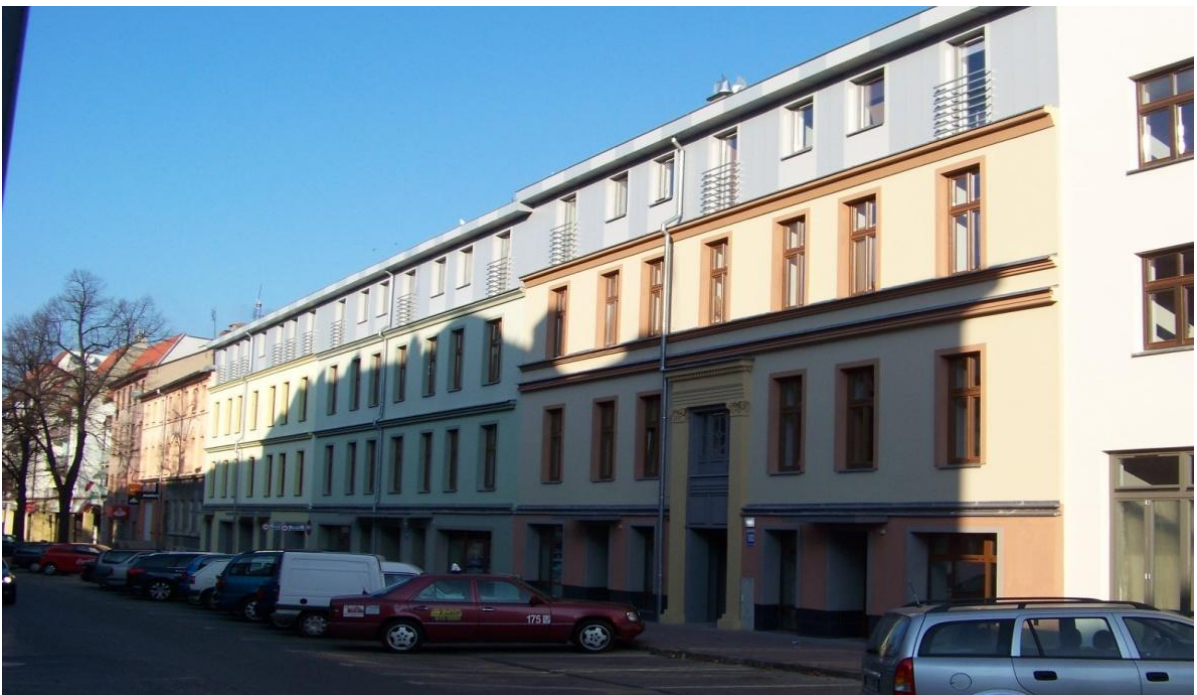
Budynki przy ul. M.J. Piłsudskiego po rewitalizacji.