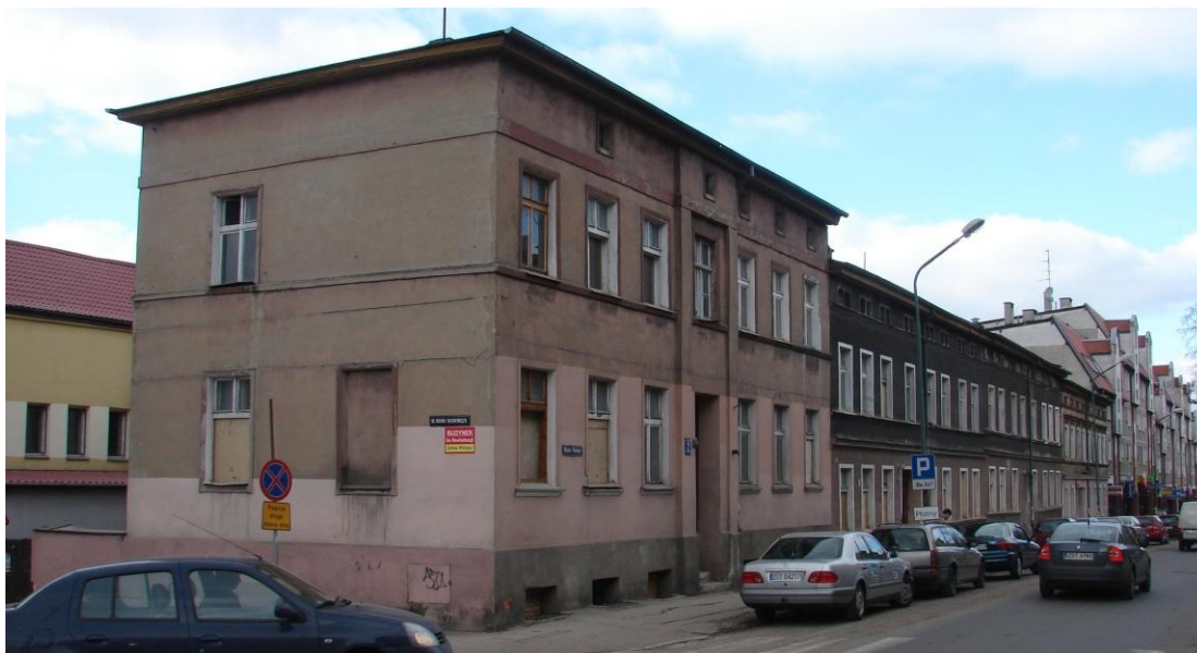
Budynki przy ul. Wojska Polskiego przed rewitalizacją.

Poniższe fotografie ukazują sytuację sprzed modernizacji i po modernizacji fragmentów kwartału: