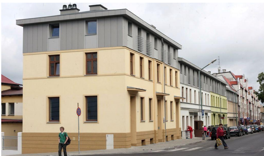
Budynki przy ul. Wojska Polskiego po rewitalizacji.