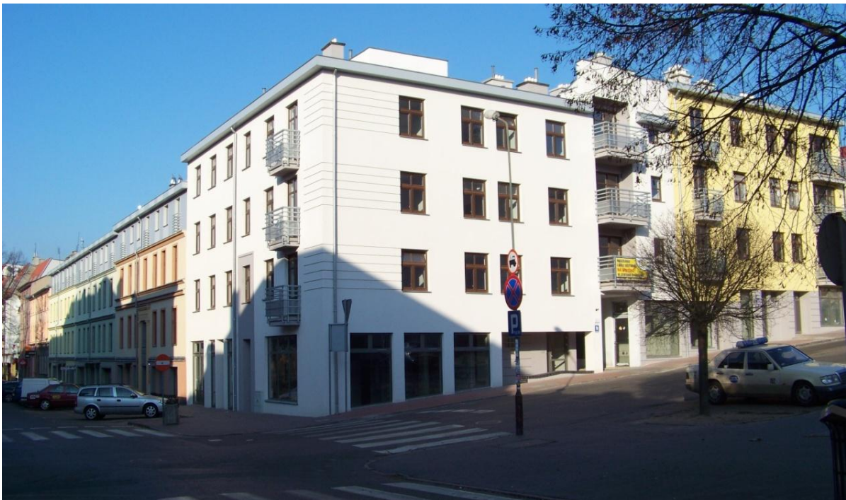
Nowowytbudowana kamienica przy ul. Adama Mickiewicza 1