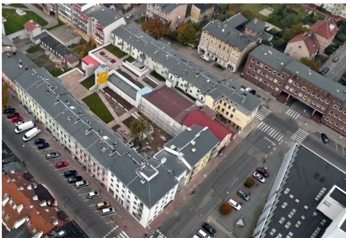
Zrewitalizowany kwartał „C” z lotu ptaka.

Zasadą w realizacji inwestycji Stargardzkiego TBS Sp. z o.o. jest tworzenie zespołów dla różnych grup społecznych, co pozwala na realizację zasady „wymieszkania społecznego”. Obok mieszkań własnościowych dla zamożnych, budowane są mieszkania na wynajem dla osób umiarkowanie zamożnych (w klasycznej formule społecznego budownictwa