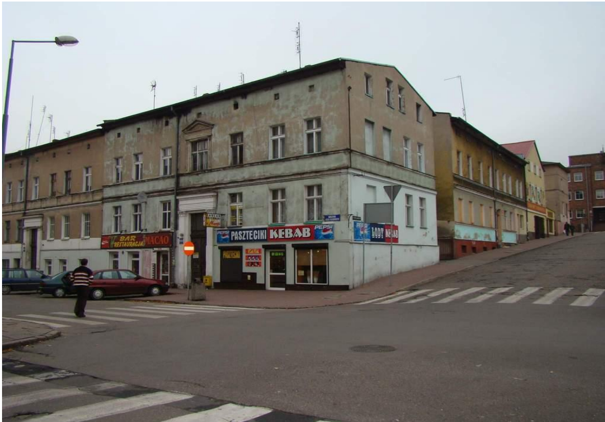
Kamienica przy ul. Piłsudskiego 104 i Mickiewicza 1 przed rewitalizacją