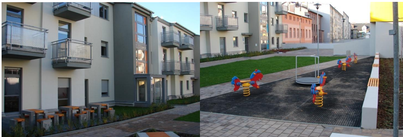
Zagospodarowanie wnętrza kwartału na dachu podziemnego garażu.