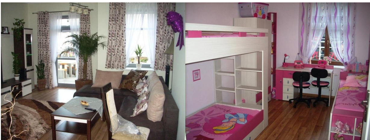
Mieszkanie rodzinkowe ul. Piłsudskiego 102-103 – pokój dzienny i pokój wychowanków

- 1 mieszkanie docelowe dla opuszczającego inkubator wychowanka domu dziecka.